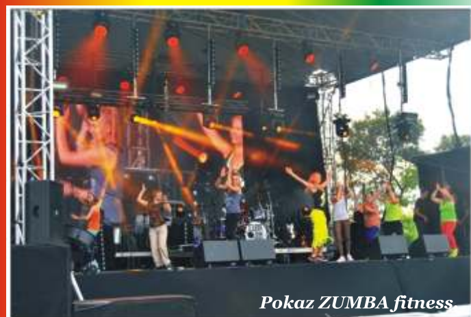
Pokaz ZUMBA fitness

Organizatorzy Święta Gminy Lesznówola 2014: Wójt i Samorząd Gminy Lesznówola, GOK, ZOPO, GBP, OSP Mroków i OSP Zamienie, MZPwGL.