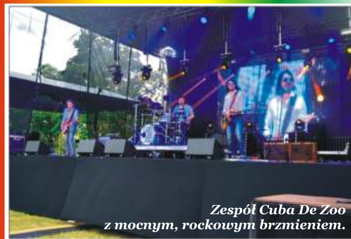
Zespół Cuba De Zoo z mocnym, rockowym brzmieniem.

Patronat medialny objęli: Tygodnik Kurier Południowy, Radio Mazowsze oraz Lokalny Portal Informacyjny: naszeplaceczko.pl