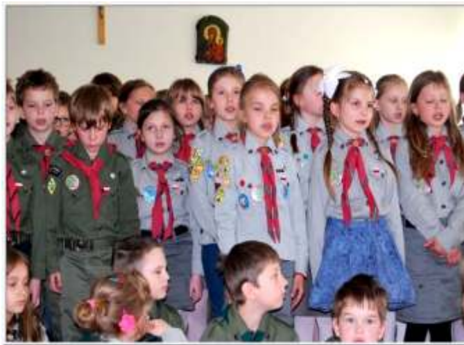
Harczerze i zuchy - uczestnicy tegorocznego Rajdu Szlakiem Naszej Historii.

Więcej zdjęć z wydarzeń na www.gok.lesznowola.pl