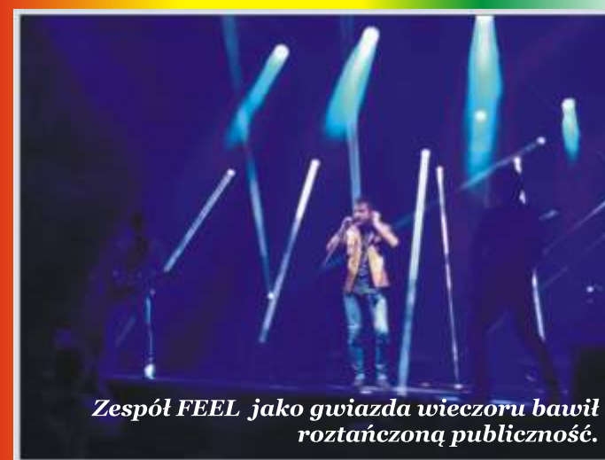
Zespół FEEL jako gwiazda wieczoru bawił roztańczoną publiczność.