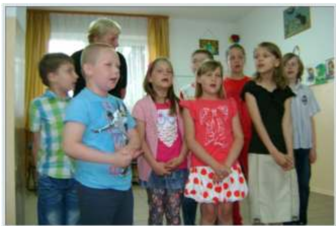
Dzieci z wielką radością odśpiewały piosenki dla swoich ukochanych Mam. Najpiękniej, jak tylko potrafiły!