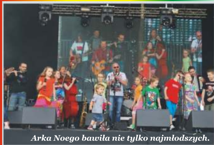
Arka Noego bawiła nie tylko najmłodszych.